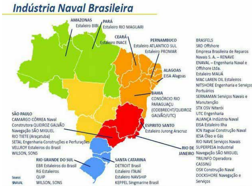
Figura 1 Estaleiros do Brasil